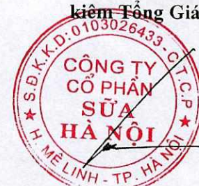
HÀ QUANG TUẤN